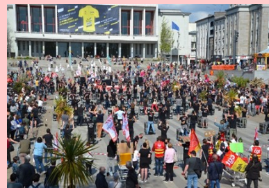
A Brest, ce ne sont pas loin de 2000 manifestants qui étaient présents.

Et à Morlaix, plus d'une centaine de participants !