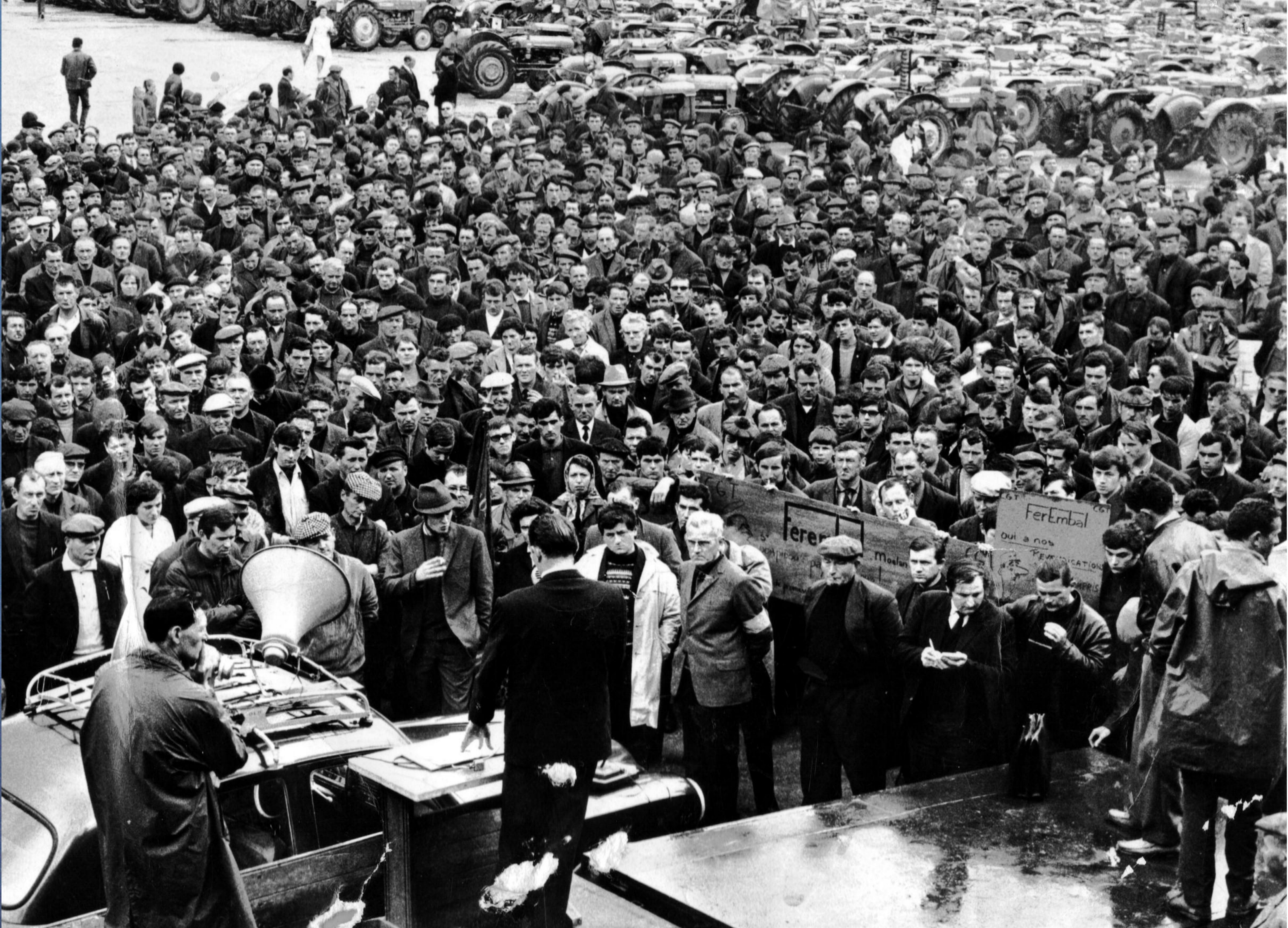
Le 27 mai, lundi de Pentecôte à Quimperlé, le défilé des fêtes de Toulfoën a laissé place à une manifestation. Quelque 1 000 tracteurs venus de la région encadrent 5 000 manifestants. Place Saint Michel, juchés sur une remorque de tracteur, les responsables syndicaux et le maire prennent la parole (photo ci-dessus).