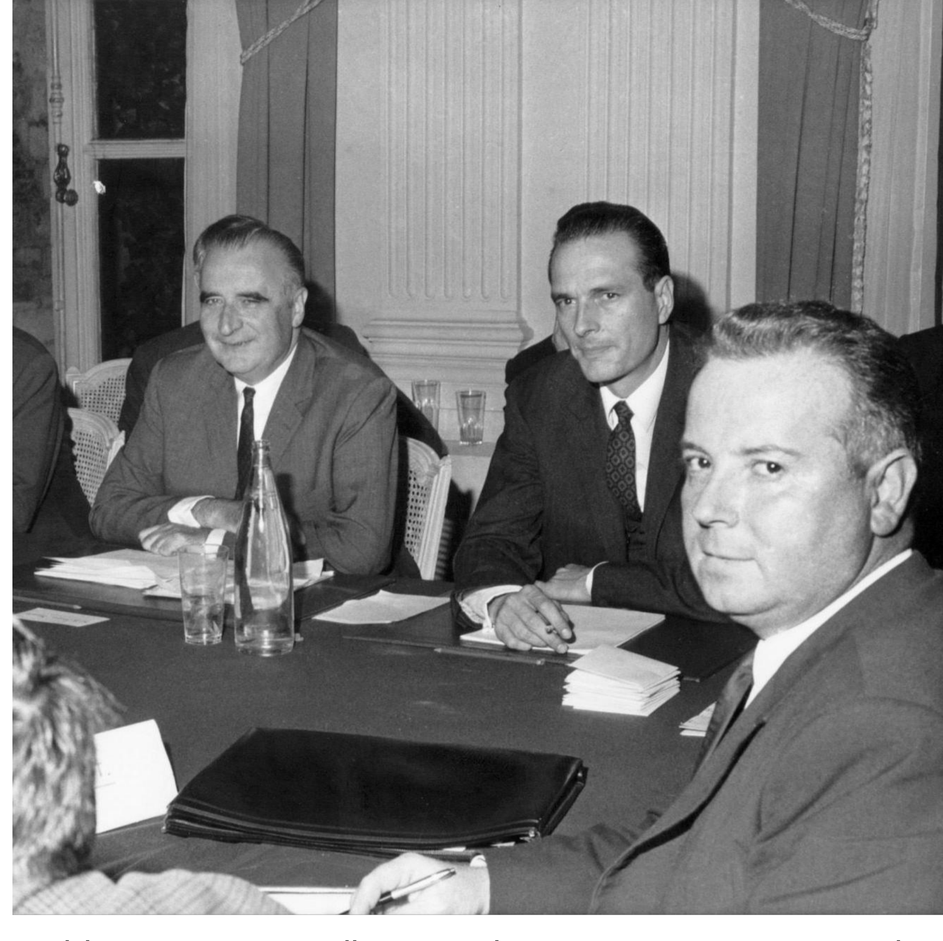
La délégation CGT à Grenelle était conduite par Georges Séguy. De gauche à droite : Pompidou, Chirac, Séguy.

âgées agitant des drapeaux tricolores. Aux élections législatives des 23 et 30 juin, la peur du chaos et l'absence de rassemblement politique à gauche malgré les efforts de la CGT et du PCF, permettent à la droite de remporter un grand succès dans le pays et le département. Avec plus de 5 000 adhésions et plus de 40 nouveaux syndicats dans le Finistère, la CGT sort la tête haute, plus puissante et plus jeune que jamais.