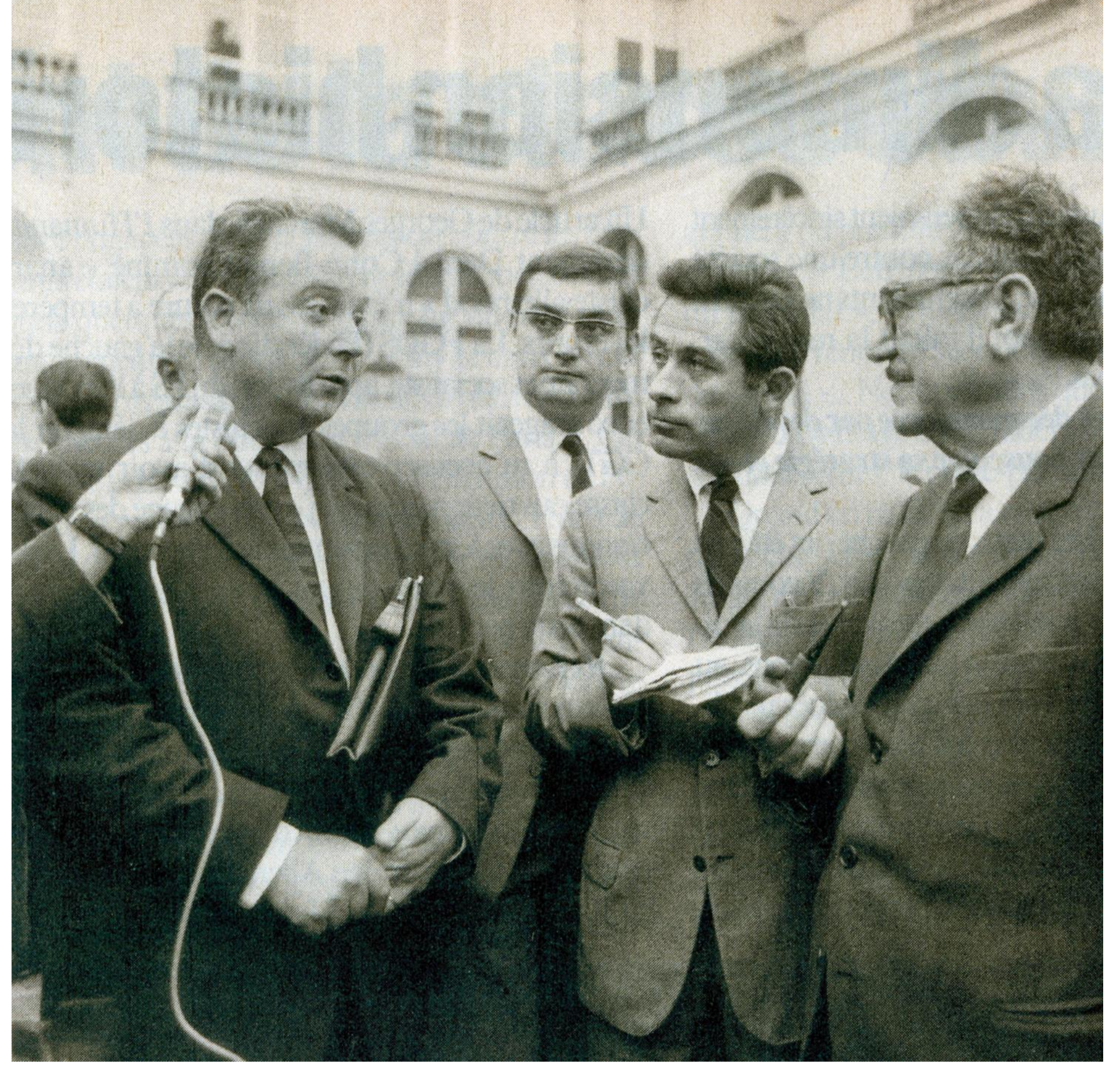
Lors d'une interruption de séance, Georges Séguy rend compte à la presse de l'évolution des négociations. À droite Benoit Frachon.