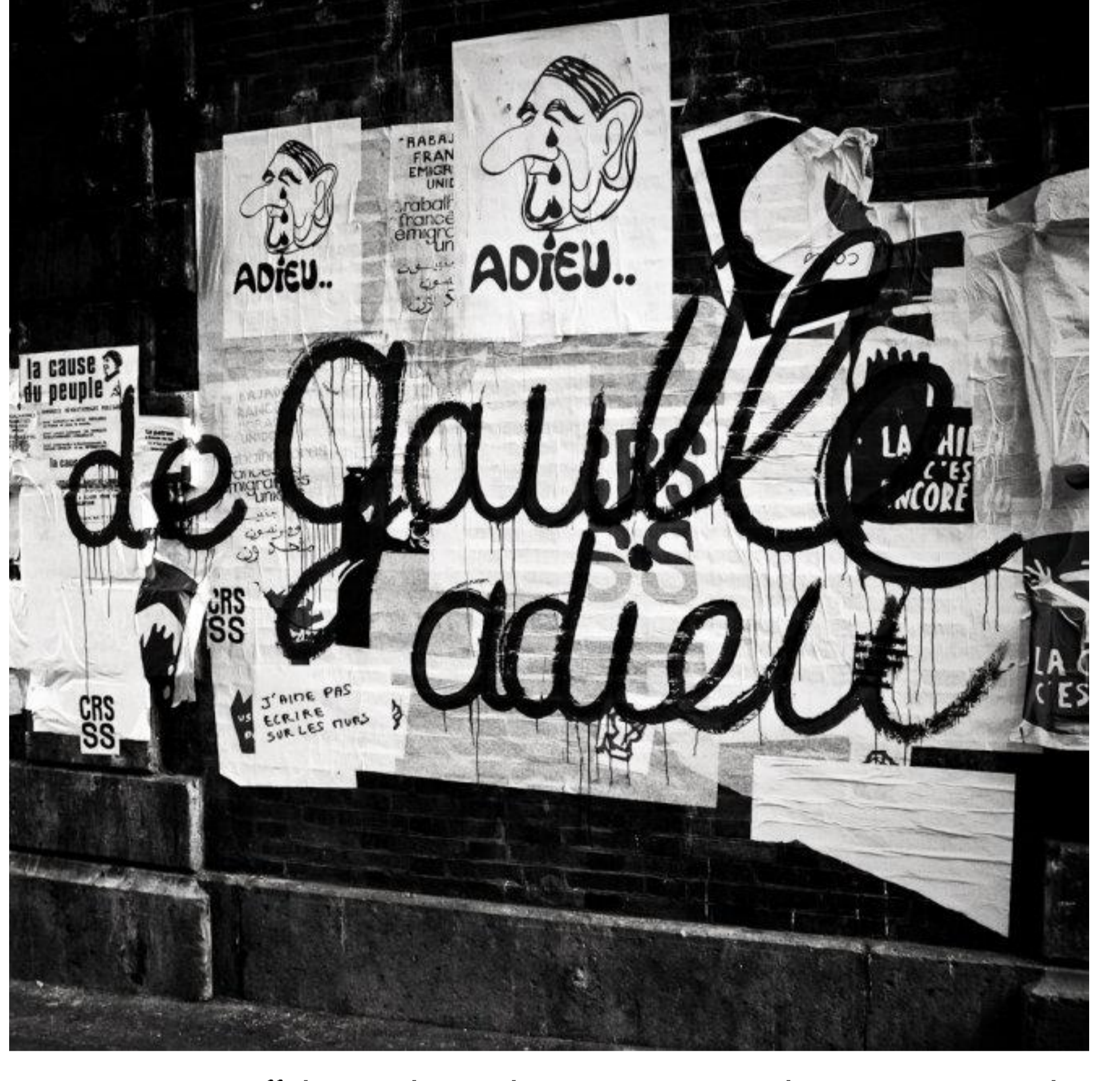
En mai-juin 68, affiches et dessins humoristiques et politiques recouvrent les murs. Ci-dessus s'exprime la volonté de voir partir de Gaulle. Il faudra attendre le référendum de 1969 pour que ce désir devienne réalité.