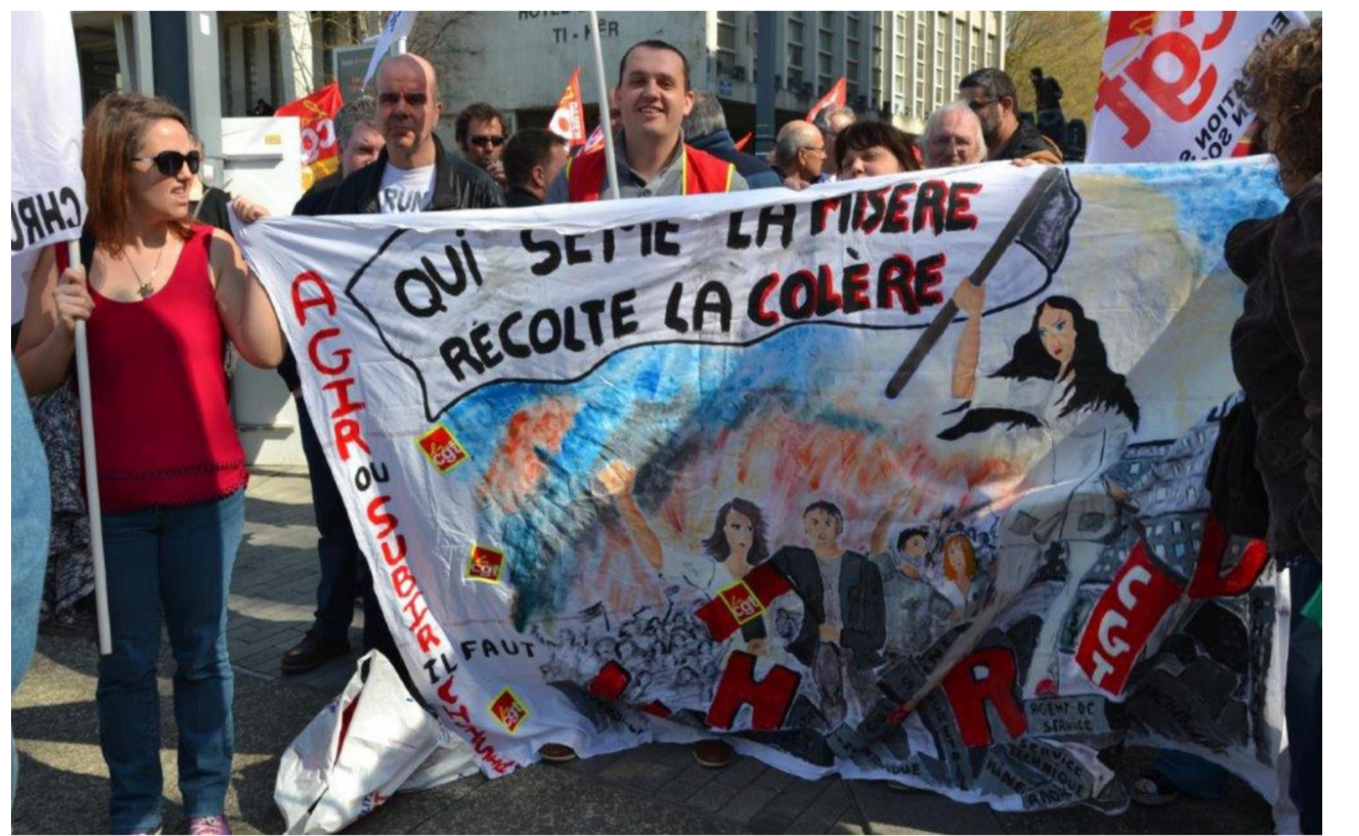
Printemps 2018 : à nouveau colère, luttes et volonté d'un monde meilleur.