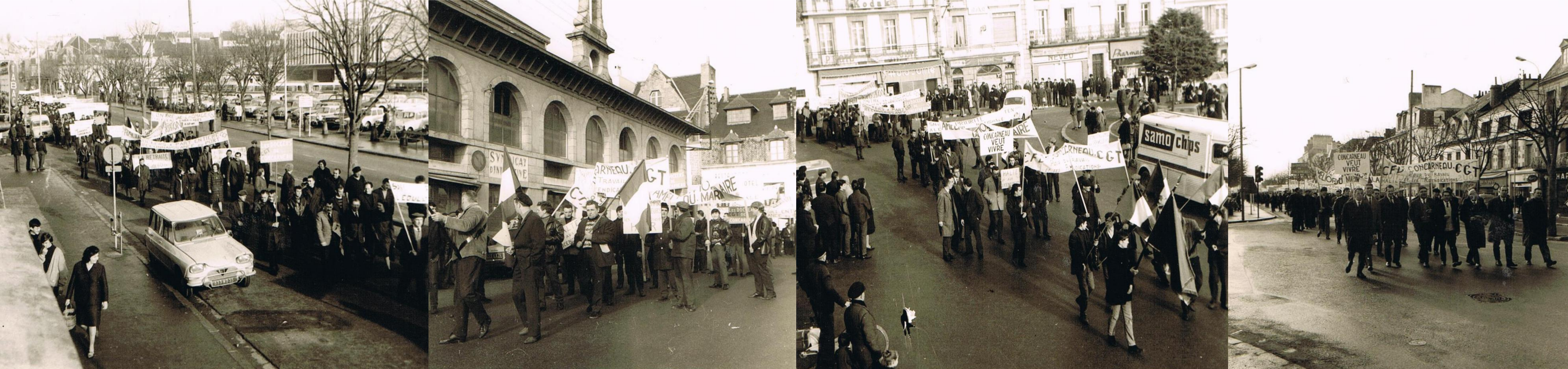
Le 1 er février 67 l'Union départementale CGT comptabilise 25 000 manifestants pour les salaires et le plein emploi. Ci-dessus, à Concarneau, les commerçants ferment leurs boutiques pendant que près de 3 000 habitants manifestent aux cris de « Concarneau veut vivre »