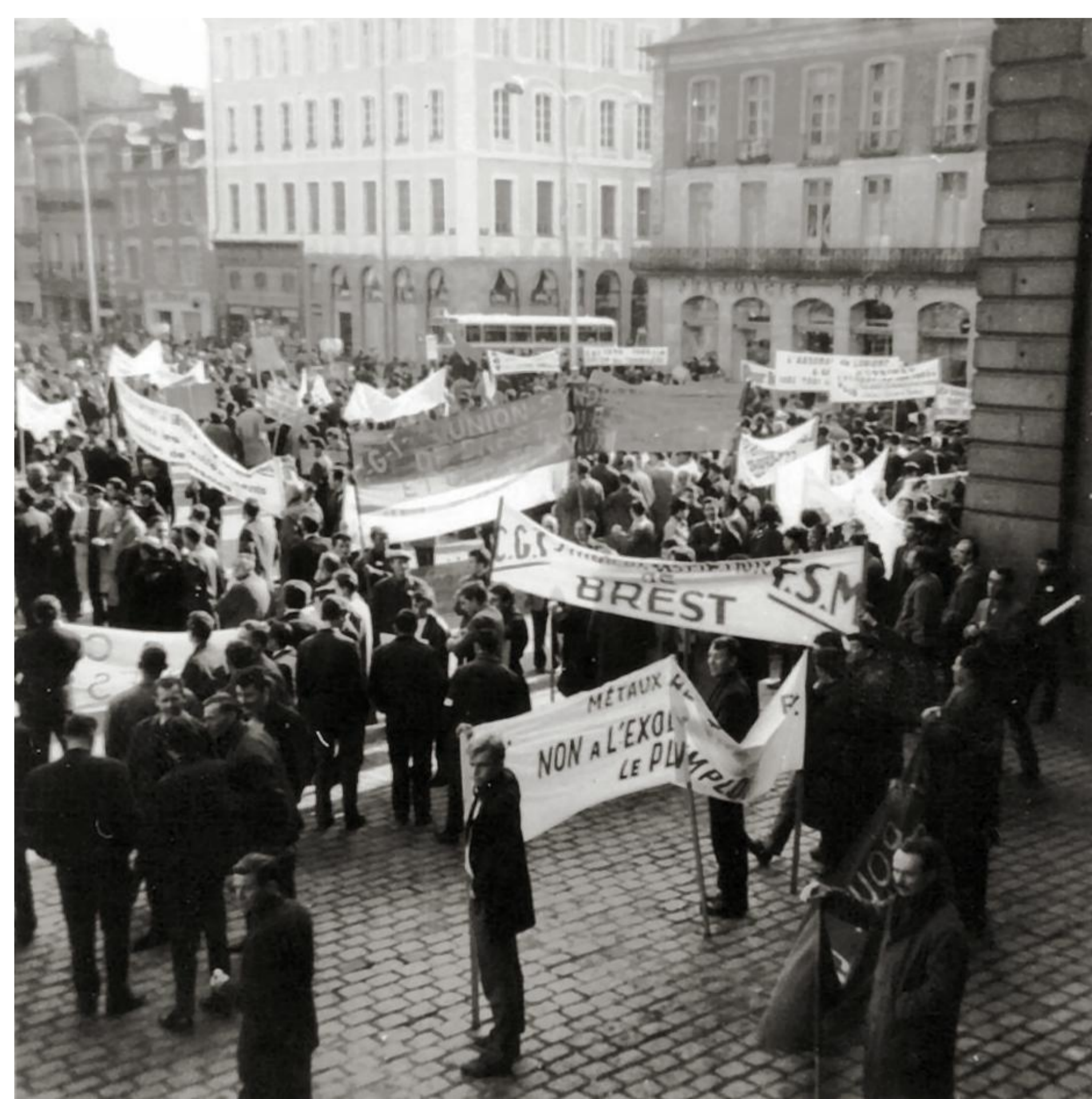
Rassemblement régional à Rennes le 29 octobre 1966 contre la politique gouvernementale et pour le développement économique de la Bretagne. 140 cars ont mis le cap sur Rennes.

jours de grève sont comptabilisés au plan national. Le baril de poudre est prêt à exploser.