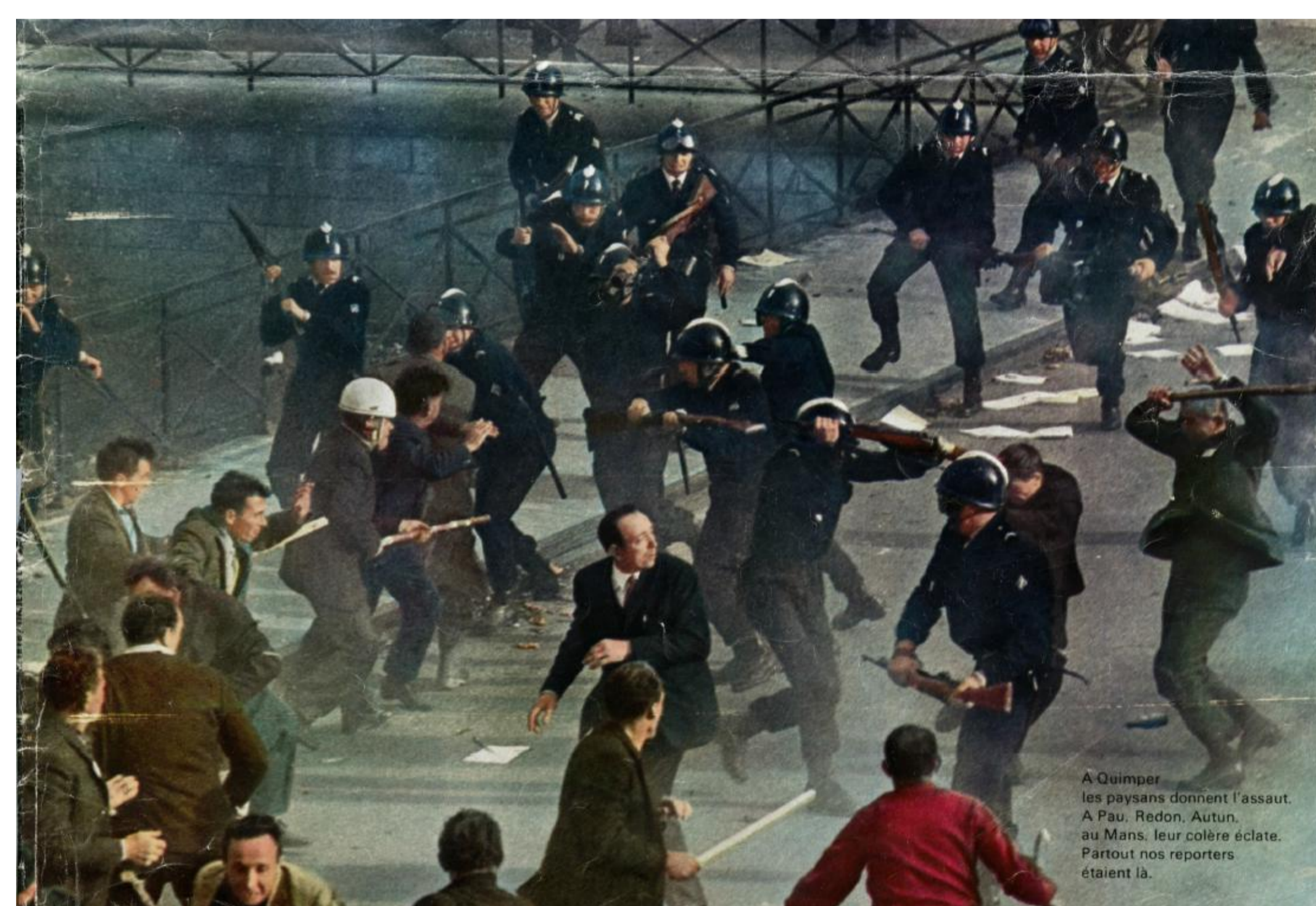
15 000 paysans se rassemblent à Quimper le 2 octobre 1967 contre les prix agricoles trop bas. Les affrontements avec les CRS feront une centaine de blessés.