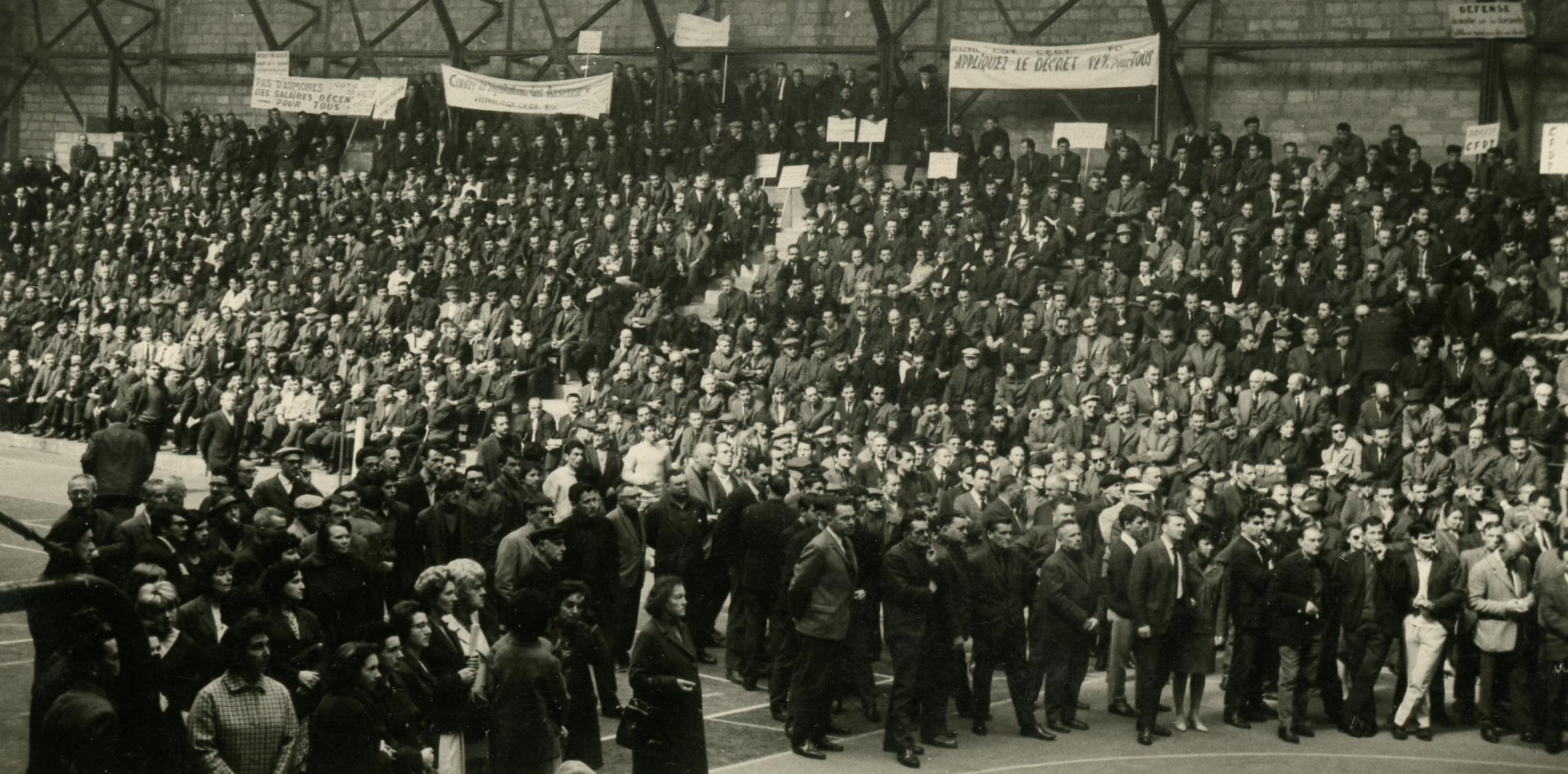
Le 17 mai 67, des millions de salariés participent à une journée d'action contre les pleins pouvoirs demandés par le gouvernement à l'appel de la CGT, la CFDT, FO et la FEN. Dans le Finistère la presse annonce 90 à 100% de grévistes. Ci-dessus le meeting salle Cerdan à Brest.