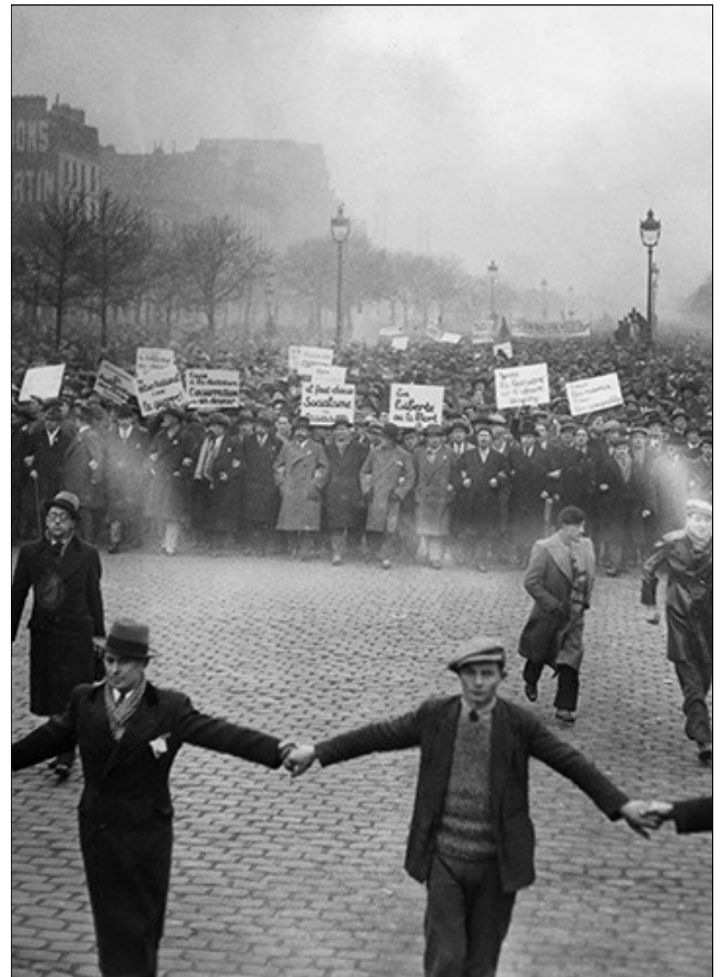
Manifestation antifasciste à Paris le 12 février 1934