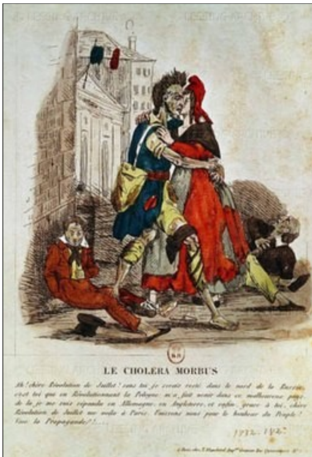
Une caricature française en 1830.