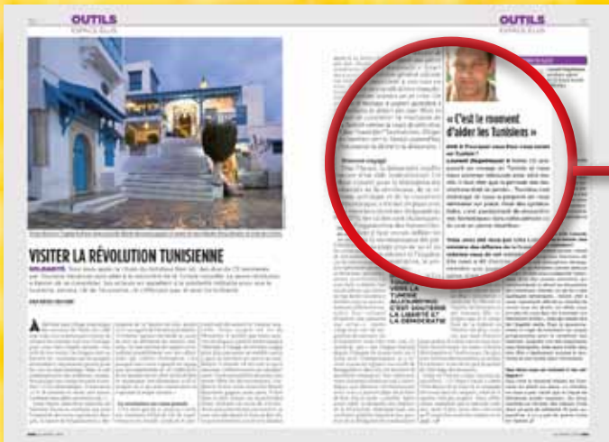
OUTILS/ESPACE ÉLUS Les infos pratiques, les expériences pour aider à l'activité des élus sont déclinées en informations et en reportages.