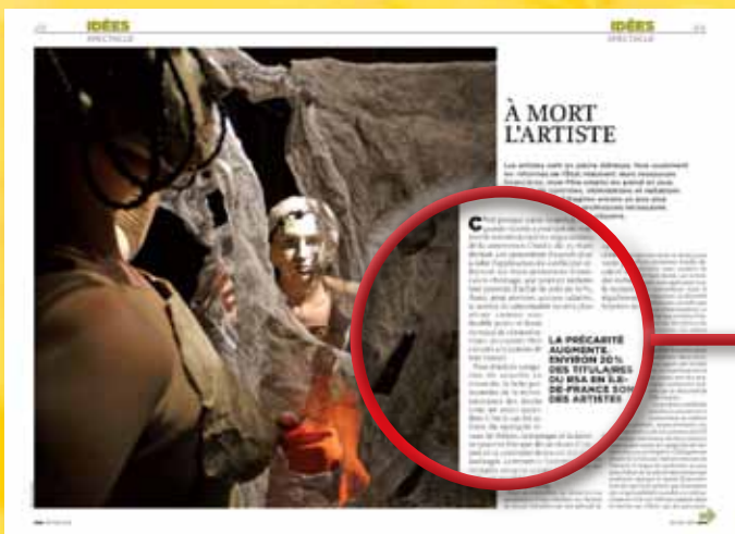
IDÉES Une enquête, un reportage sur les questions de culture et de société.