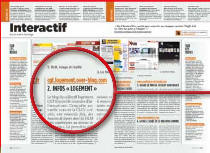
INTERACTIF permet d'avoir une recension des sites web de syndicats, d'associations, de réflexions.