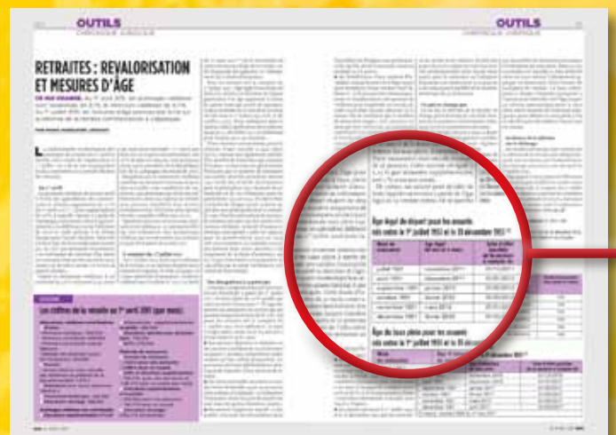
OUTILS/CHRONIQUE JURIDIQUE décortique la jurisprudence, les commentaires, vos droits dans l'entreprise.