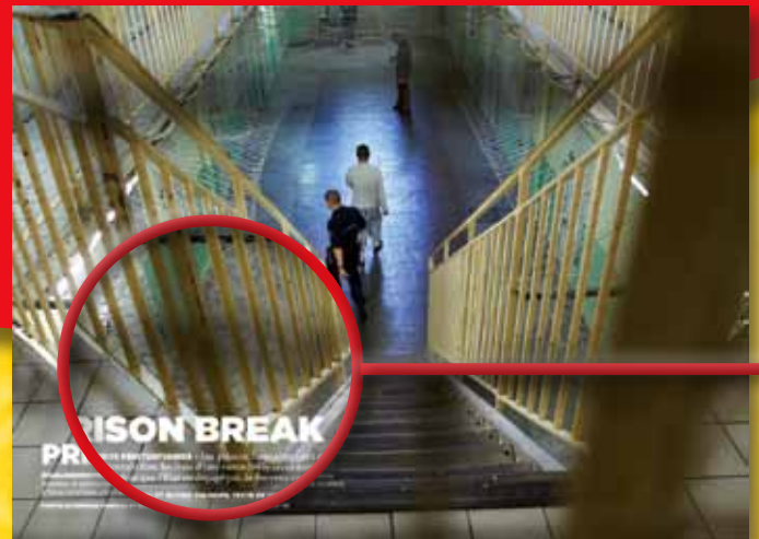
GRAND ANGLE , sur 7 pages, vous fait découvrir en images l'envers du décor avec la participation de grands photographes.