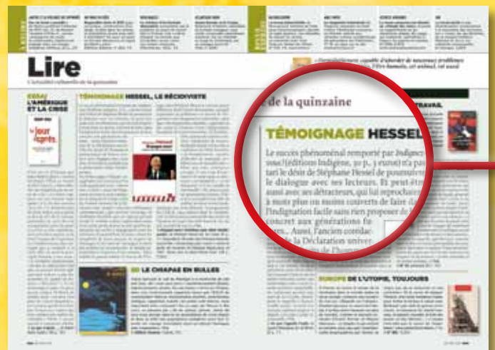
LIRE/VOIR/SORTIR Cinq pages d'informations culturelles et de sciences sociales. Et, aussi, des pages histoire...